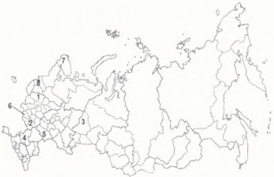
Рис. Картограмма административно-территориального деления России

Задача 5. На карте России цифрами отмечены субъекты, в которых расположены важные объекты топливно-энергетического комплекса России. Что это за объекты? Впишите названия данных объектов в таблицу, укажите названия субъектов, в которых они расположены.